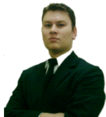
Autor: Alejandro Figueroa Presidente de Ingresos en Internet www.ingresoseninternet.com